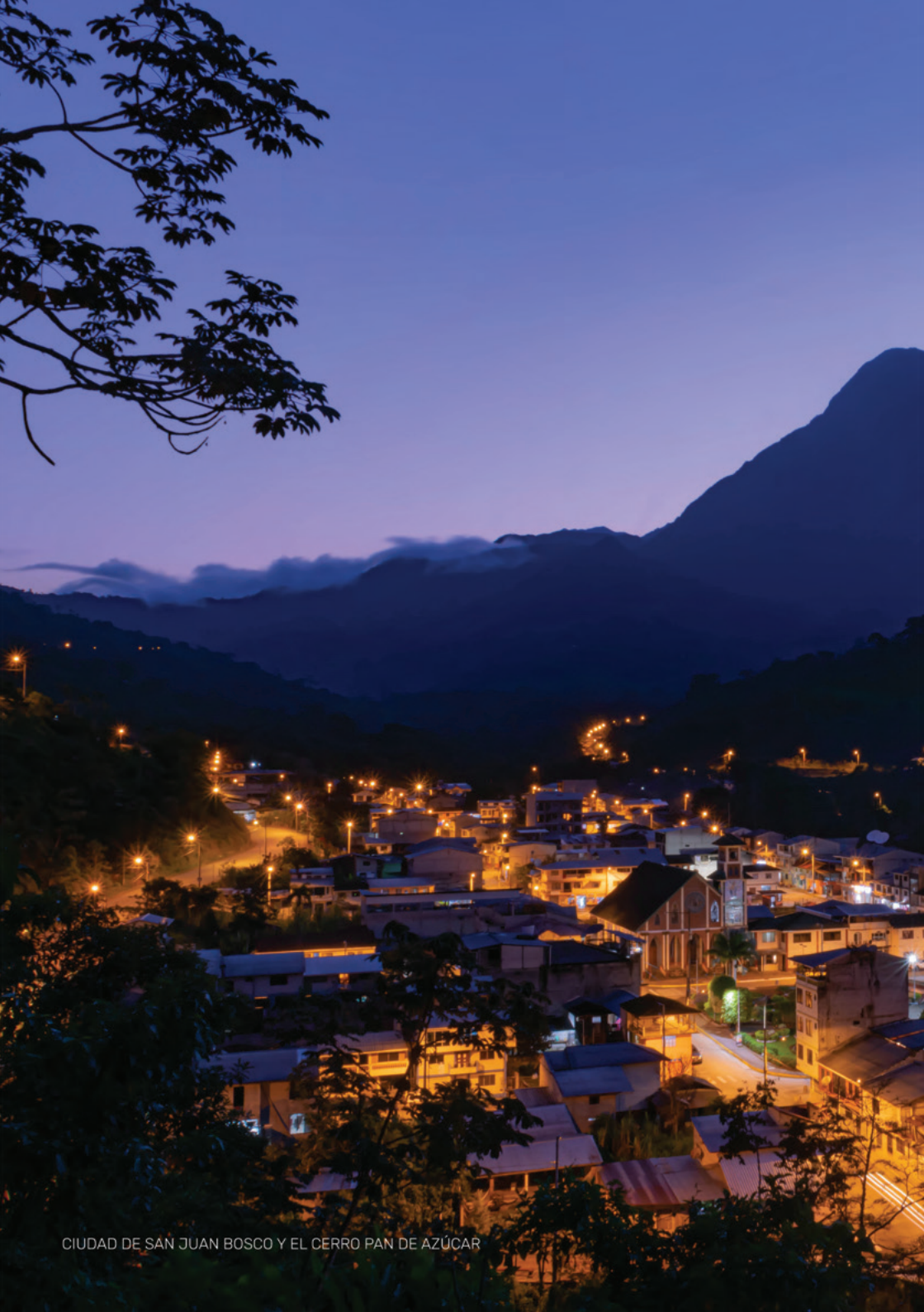
CIUDAD DE SAN JUAN BOSCO Y EL CERRO PAN DE AZÚCAR